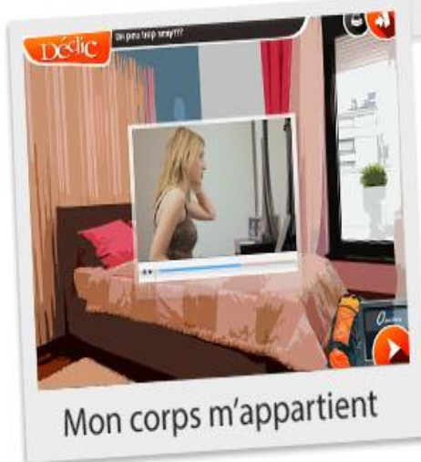
Mon corps m'appartient

Les trois parcours cherchent à agir sur des facteurs de risque tout en renforçant les facteurs de protection qui ont été priorités en concertation avec nos partenaires des milieux communautaire, scolaire et de la sécurité publique.