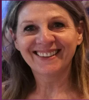
Lyne Larouche Administration